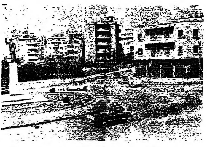
دورية لقوى الأمن في ساحة عبدالحميد كرامي بطرابلس

أمد التوتير الى اتجاه بقرقة من العصابة وضواحيها امس، وسقط ٦ قتلى و ٣ جرحى نتيجة أعمال العنف التي شهدتها منطقة التهمة وسن القيل، ولوحظ ان رصاص القناصة عاد مجددا ليثر موجة من الخوف. وقد استعملت قوى الأمن أمس بقوات اضافية من الدرك استقدمها من منطقة القبة في طرابلس، وبمدا